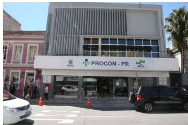
Sede do PROCON - PR